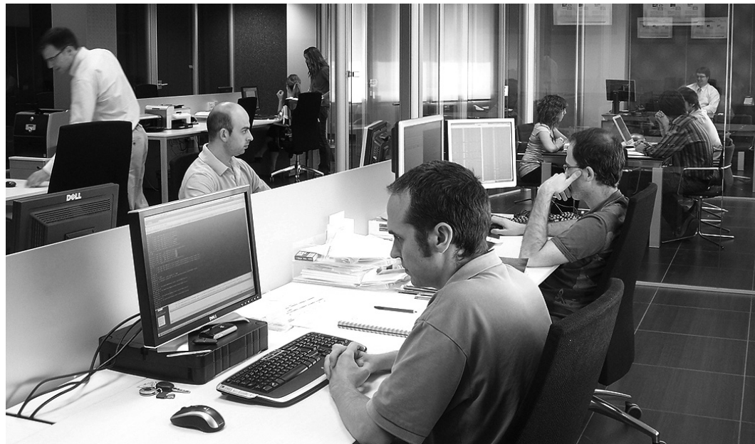
Las instalaciones de ITS-Security están ubicadas en el polígono Kurutz Gain de la localidad guipuzcoana de Mendaró